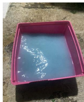
Gambar 4. Pencampuran dari bunga telang dan kertas hvs dengan air sebelum penyaringan.