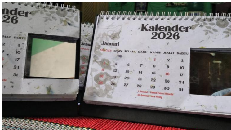
Gambar 8. Hasil jadi kalender duduk tahun 2026.

Gambar 8 menunjukkan hasil jadi kalender duduk tahun 2026. Produk tersebut memiliki motif bercak ungu dan hijau pada kertas, hasil dari campuran bunga telang dan kertas daur ulang. Kalender juga dilengkapi cermin sebagai fitur tambahan.