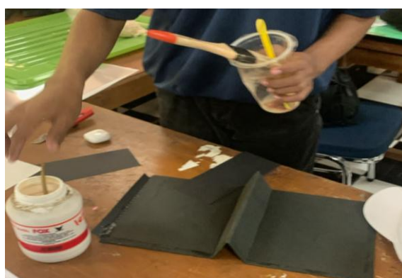
Gambar 7. Proses perakitan dudukan kalender.

Gambar 2 sampai dengan Gambar 6 menunjukkan dokumentasi tahapan proses pembuatan kertas daur ulang. Sementara itu, Gambar 7 adalah dokumentasi proses perakitan dudukan kalender.