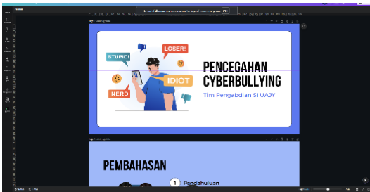
(b) Pembuatan PowerPoint materi pengabdian

Kami akan membuat filter menggunakan MetaSparkAR untuk membantu siswa mengidentifikasi dan memahami cyberbullying dengan lebih baik.