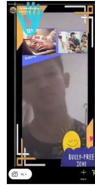
(d) Filter AR Instagram

Untuk mengevaluasi pemahaman siswa-siswi tentang cyberbullying sebelum dan setelah penyampaian materi, kami menggunakan Google Form untuk membuat kuesioner. Kuesioner ini dirancang untuk memahami tingkat kesadaran mereka terhadap masalah ini sebelum diberikan materi, serta sejauh mana pemahaman mereka meningkat setelah materi disampaikan. Dengan menggunakan alat ini, kami berharap dapat mengukur efektivitas penyampaian materi tentang cyberbullying dan melihat perubahan pemahaman siswa-siswi dari sebelum hingga setelah pembelajaran. Data yang kami kumpulkan dari kuesioner ini akan menjadi landasan bagi kami dalam merancang program-program pendidikan yang lebih efektif untuk meningkatkan kesadaran dan pencegahan terhadap cyberbullying di lingkungan sekolah.