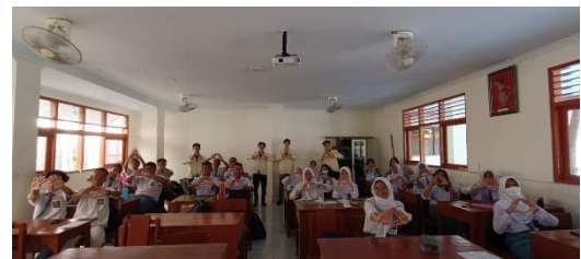
(a) Foto bersama paska kegiatan

Foto bersama pasca kegiatan dilakukan untuk dokumentasi dan pelaporan. Foto pasca kegiatan juga dapat membantu dalam evaluasi dan penilaian kegiatan yang dilaksanakan