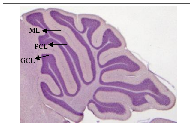
Gambar 2. Penampang sagital cerebellum fetus mencit umur 21 hari. Perbesaran 40x

Keterangan : K = Kelompok Kontrol PCB = Kelompok Placebo P1 = Kelompok Perlakuan 0,5 mg/kg bb PII = Kelompok Perlakuan 1,0 mg/kg bb PIII = Kelompok Perlakuan 1,5 mg/kg bb