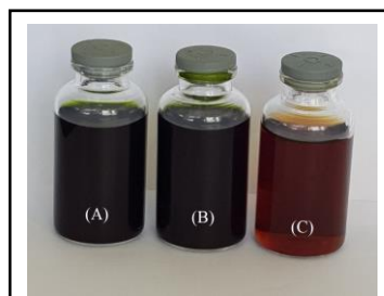
Gambar 3. Larutan hasil ekstraksi daun saga rambat menggunakan etanol (A), metanol (B), dan air (C).