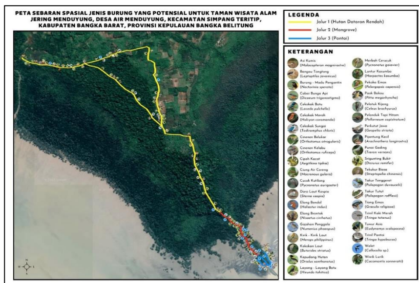
Gambar 3. Peta interpretasi jenis dan sebaran burung di Taman Wisata Alam Jering Menduyung