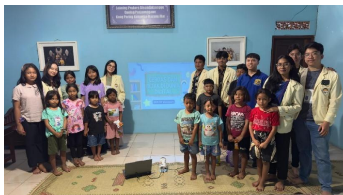
Gambar 7. Foto Bersama Usai Pelaksanaan Program Kerja

Saran untuk kegiatan pengabdian serupa adalah kegiatan pengabdian dapat terus dilanjutkan dan dikembangkan, tidak hanya di Padukuhan Wonosari tetapi juga di komunitas lain yang membutuhkan. Untuk efektivitas yang lebih optimal, disarankan untuk melibatkan partisipasi aktif dari orang tua dan pihak sekolah dalam program lanjutan, serta mengembangkan modul edukasi yang lebih mendalam dan berkelanjutan untuk membentuk karakter digital yang positif secara menyeluruh.