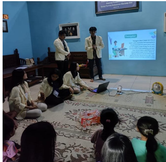
Gambar 6. Pelaksanaan Program Kerja di Posko KKN UAJY 31 Wonosari