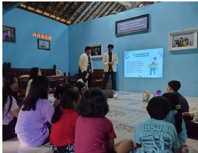
Gambar 5. Pelaksanaan Program Kerja di Posko KKN UAJY 31 Wonosari

aman dan etis di tengah maraknya kasus cyberbullying . Anak-anak juga menyatakan bahwa materi yang disampaikan sangat relevan dan bermanfaat bagi mereka.