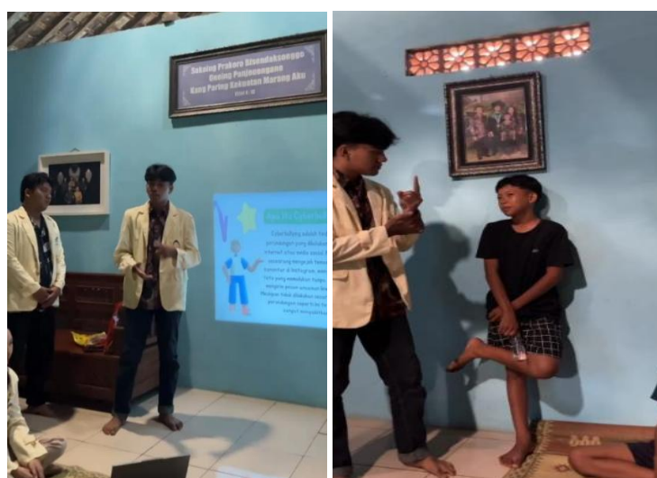
Gambar 3. Pelaksanaan Program Kerja di Posko KKN UAJY 31 Wonosari

Program pengabdian dengan judul "Sosialisasi Etika dalam Media Sosial dan Bahaya Cyberbullying di Padukuhan Wonosari" telah berhasil dilaksanakan pada Rabu, 16 Juli 2025. Dokumentasi pelaksanaan program pengabdian ada pada Gambar 3, 5, 6, dan 7. Ada dua belas anak-anak yang mengikuti sosialisasi ini. Materi utama mencakup sosialisasi dampak cyberbullying , identifikasi tanda-tanda, dan strategi pencegahan melalui workshop interaktif selama satu jam. Selama workshop, 90% partisipan aktif berdiskusi kasus nyata yang pernah terjadi. Feedback kualitatif menunjukkan bahwa mereka merasa "Saya sekarang tahu cara melaporkan cyberbullying di media sosial". Selain itu, di lingkungan rumah dan sekolah mereka tidak ada insiden cyberbullying dilaporkan selama monitoring 1 minggu pasca-kegiatan.