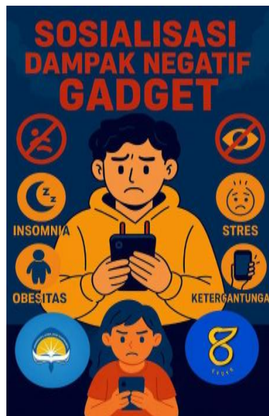
Gambar 4. Poster Sosialisasi Dampak Negatif Gadget

Pada tahap pelaksanaan, sosialisasi disampaikan melalui metode presentasi yang didukung oleh media visual (PowerPoint) dan diskusi interaktif. Kegiatan ini berhasil menarik perhatian anak-anak Padukuhan Wonosari. Suasana selama sesi presentasi sangat partisipatif, di mana anak-anak menunjukkan antusiasme tinggi dalam menyimak materi dan aktif mengajukan pertanyaan. Sesi diskusi dua arah memungkinkan tim pengabdian untuk mengklarifikasi pemahaman peserta serta memberikan contoh-contoh kasus yang relevan dan mudah dicerna. Penggunaan bahasa yang sederhana dan lugas turut membantu penyampaian informasi yang kompleks menjadi lebih mudah diterima. Poster sosialisasi dampak negatif gadget juga ditampilkan agar makin menarik seperti pada Gambar 4.