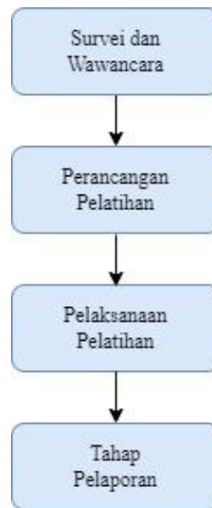
Gambar 1. Tahapan pengabdian.

Berikut ini adalah detail tahapan pengabdian: