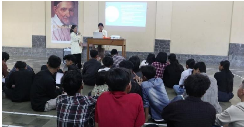
Gambar 1 Sesi Pengenalan dan penjelasan Canva.