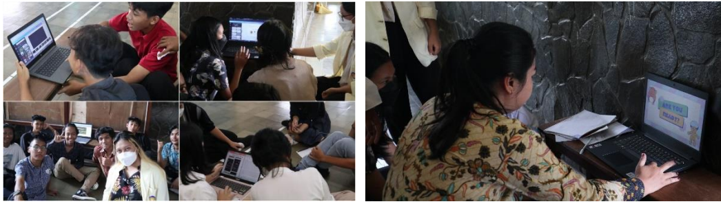
Gambar 3 Praktek Canva dan penjurian.