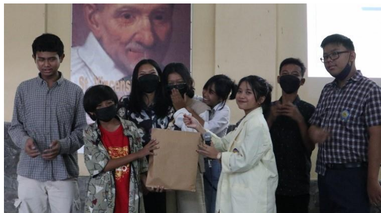
Gambar 4 Pemberian hadiah kepada kelompok dengan desain terbaik.

Setelah semua rincian kegiatan dilaksanakan seluruh peserta mengisi evaluasi untuk mencari tahu hasil pelatihan aplikasi Canva sebagai media pembuatan desain materi presentasi secara menyeluruh. Pengisian evaluasi dilakukan secara manual, di mana angket dibagikan kepada peserta dalam bentuk selebaran kertas. Metode evaluasi yang dilakukan menggunakan metode skala likert.