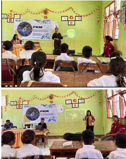
Gambar 5. Sesi Penjelasan Materi

pengabdian juga memperkenalkan teknologi berupa IoT kepada siswa. Siswa sangat antusias terhadap semua materi yang diberikan. Gambar 5 menunjukkan proses pengenalan bumi serta penjelasan konsep sains dan teknologi.