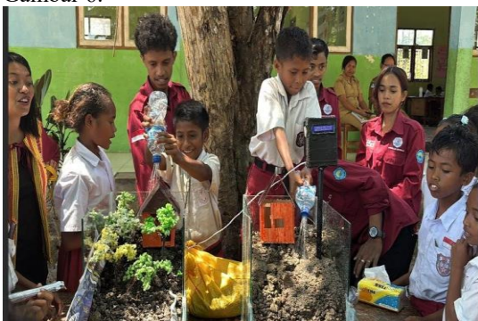
Gambar 6. Perakitan Miniatur Longsor

Pada sesi ini siswa diajak berpartisipasi aktif membantu menyusun bagian-bagian miniatur, seperti menata lapisan tanah dan pasir pada wadah, menempatkan sensor kelembapan dan sensor kemiringan di posisi yang tepat, serta menyambungkan kabel pada papan mikrokontroler. Kegiatan ini bertujuan agar siswa dapat melihat langsung bagaimana sistem IoT dirangkai dan berfungsi. Mahasiswa menjelaskan fungsi masing-masing komponen seperti NodeMCU, sensor tanah, LED indikator, dan buzzer dengan cara sederhana. Sesi ini berlangsung dengan suasana belajar yang menyenangkan karena siswa bekerja dalam kelompok kecil dan saling membantu dalam proses perakitan. Proses perakitan miniatur longsor berbasis IoT bersama siswa ditampilkan pada Gambar 6.