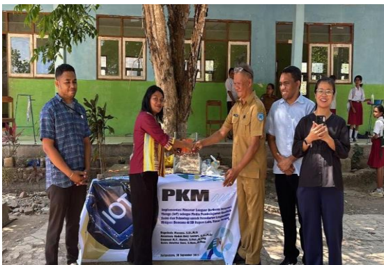
Gambar 9. Serah-Terima Miniatur Longsor

Sebagai bagian dari keberlanjutan program, miniatur longsor berbasis IoT diserahkan kepada sekolah sebagai sarana pembelajaran mandiri. Tim pengabdian juga menyediakan panduan tertulis mengenai cara penggunaan dan pemeliharaan alat agar dapat digunakan oleh siswa dan guru dalam pembelajaran selanjutnya. Proses serah terima alat dari Tim Pengabdian ke Sekolah melalui Kepala Sekolah ditampilkan pada Gambar 9.