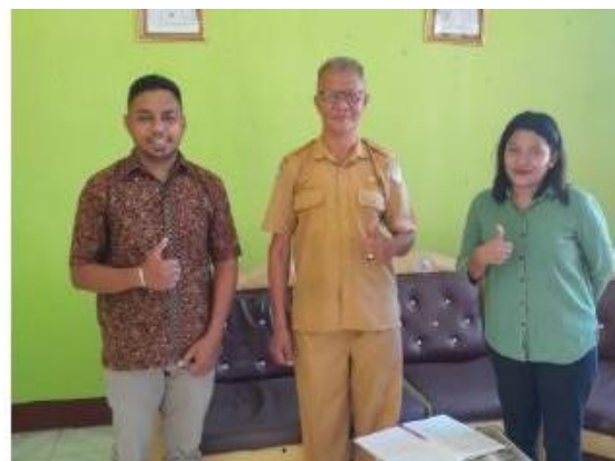
Gambar 2. Survei dan Kesepakatan Pelaksanaan Kegiatan

SD Negeri Lulu merupakan sekolah negeri yang berada di Kefamenanu. Sekolah ini menerapkan pembelajaran yang sesuai dengan kurikulum yang sedang berjalan. Lokasi sekolah berada pada wilayah dengan potensi longsor. Selain minat siswa terhadap pembelajaran sains dan teknologi yang rendah, media pembelajaran sains di sekolah ini juga masih sangat minim sehingga tidak mampu meningkatkan minat siswa terhadap pembelajaran. Media pembelajaran diperlukan selain untuk meningkatkan minat siswa juga media pembelajaran harus layak dalam segi teknis, fungsi dan unjuk kerja dalam penggunaannya [14]. Berdasarkan hasil diskusi, diperoleh Solusi berupa implementasi media pembelajaran berbasis IoT berupa miniature longsor. Selain untuk meningkatkan minat terhadap sains dan teknologi, miniatur longsor ini juga bertujuan untuk meningkatkan pemahaman siswa terhadap bencana dan mitigasi bencana longsor. Gambar 2 menunjukkan kegiatan survei dan kesepakatan antara Tim Pengabdian dan Kepala Sekolah SD Lulu.