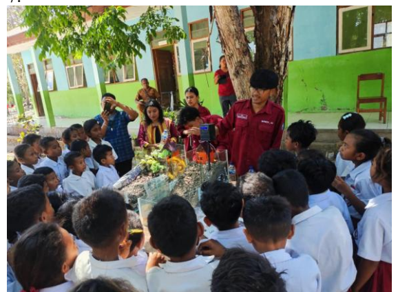
Gambar 7. Penerapan dan Penggunaan Miniatur Longsor Berbasis IoT

Setelah miniatur selesai dirakit, siswa melakukan eksperimen dengan mengamati bagaimana perubahan kelembapan tanah dan kemiringan lereng mempengaruhi kestabilan tanah. Sensor merekam data yang kemudian ditampilkan dalam sistem pemantauan digital sederhana, memungkinkan siswa untuk menganalisis faktor-faktor pemicu longsor secara real-time [16]. Penerapan miniatur menunjukkan bahwa pada miniatur yang tidak terdapat pohon mudah terjadi longsor. Saat longsor terjadi, buzzer akan berbunyi dan memberikan peringatan kepada Masyarakat. Penerapan dan penggunaan miniatur longsor Bersama siswa dan guru ditampilkan pada gambar 7.