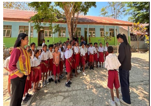
Gambar 4. Dokumentasi pre-test

Hasil pre-test menunjukkan bahwa pengetahuan dasar siswa tentang geofisika dan mitigasi bencana masih sangat terbatas, sedangkan pembelajaran IPA didominasi dengan aspek biologi dasar. Hal ini menunjukkan bahwa pembelajaran tentang bumi, kebencanaan, mitigasi dan miniatur longsor berbasis IoT sangat relevan dan dibutuhkan. Kegiatan ini dapat memperluas wawasan siswa terhadap cabang ilmu sains lain yang berhubungan langsung dengan fenomena alam dan kehidupan sehari-hari mereka