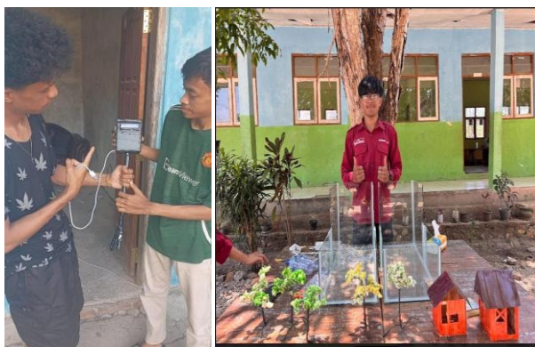
Gambar 3. Pembuatan Miniatur Longsor

Seluruh komponen dirakit dalam bentuk miniatur dengan skala sederhana namun tetap menggambarkan kondisi nyata lereng. Sistem dirancang agar data sensor dapat dikirim dan dipantau secara real-time melalui tampilan digital menggunakan dashboard IoT sederhana yang terhubung ke jaringan Wi-Fi. Gambar 3 menunjukkan proses pembuatan miniature longsor yaitu pembuatan IoT dan kotak simulasi longsor. Selama tahap persiapan, tim juga melakukan pengujian awal ( testing ) untuk memastikan setiap sensor berfungsi sesuai rencana. Sensor kelembapan diuji dengan variasi kadar air pada tanah, sedangkan sensor getaran diuji menggunakan getaran mekanik ringan. Jika sensor mendeteksi perubahan signifikan, sistem otomatis menyalakan lampu indikator merah dan buzzer sebagai tanda peringatan.