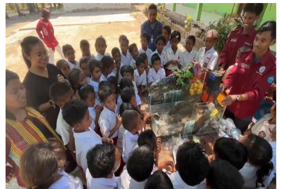
Gambar 8. Penjelasan Materi

Setelah eksperimen selesai, tim pengabdian menjelaskan hasil pengamatan serta mengajarkan cara membaca dan menganalisis data dari sensor. Proses Sesi ini juga mencakup diskusi mengenai bagaimana pengetahuan ini dapat diterapkan dalam kehidupan sehari-hari untuk meningkatkan kesiapsiagaan bencana. Gambar 8 menunjukkan proses penjelasan materi dari hasil praktek penggunaan miniatur longsor.