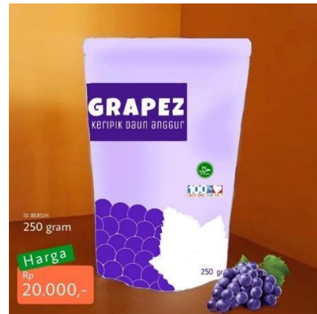
Gambar 16. Kemasan Keripik Daun Anggur Grapez