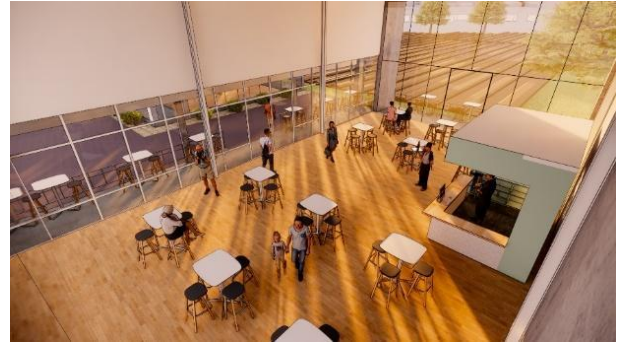
Gambar 12. Kafe Tampak Dalam

ditawarkan kepada para pengunjung yang ingin mengkonsumsi di kafe sambil menikmati aneka produk konsumsi lainnya.