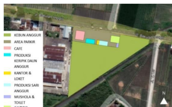
Gambar 2. Blok Plan Jogja Anggur