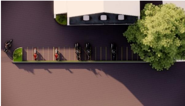
Gambar 15. Area Parkir Motor

kendaraan merasa aman untuk membawa kendaraan pribadi.