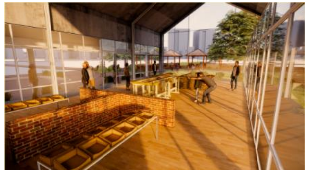
Gambar 6. Tampak Kiri Rumah Produksi Keripik Daun Anggur

Rumah produksi keripik daun anggur terdapat di area seberang loket masuk dengan tujuan agar wisatawan dapat melihat secara langsung pengolahan daun anggur menjadi keripik daun anggur dan memudahkan staf kebun anggur dalam menunjukkan proses pengolahan produk setelah wisatawan selesai berkeliling kebun anggur.