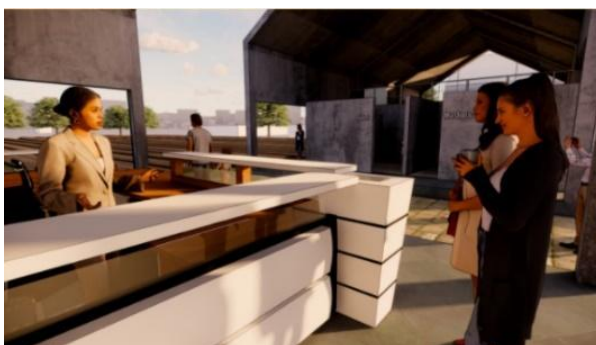
Gambar 4. Loket Masuk Jogja Anggur

Pintu masuk Jogja Anggur terdiri dari loket dan beberapa fasilitas umum seperti toilet dan musala. Konsep bangunan yang open space bertujuan agar sirkulasi udara di wisata tetap asri dan segar untuk para wisatawan. Toilet dan musala diletakkan di area pintu masuk bertujuan untuk mempermudah wisatawan.