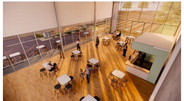
Gambar 13. Kafe Tampak Luar