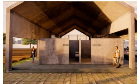
Gambar 5. Toilet dan Musala