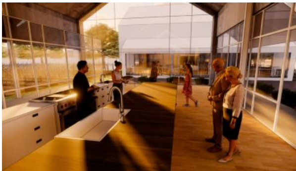
Gambar 9. Tampak Kanan Rumah Produksi Sari Anggur