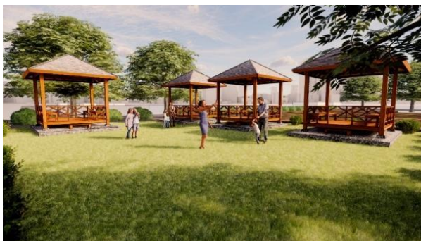
Gambar 10. Area Gazebo Tampak Luar

Gazebo terletak berdekatan dengan musala, konsep wisata kebun anggur ini menyediakan tempat bagi para pengunjung untuk dapat menikmati pemandangan sekaligus beristirahat. Gazebo juga menjadi pilihan bagi pengunjung untuk menyantap hasil olahan dari kebun anggur.