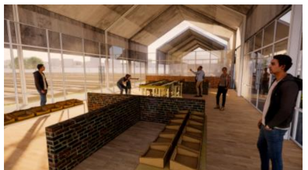
Gambar 7. Tampak Kanan Rumah Produksi Keripik Daun Anggur