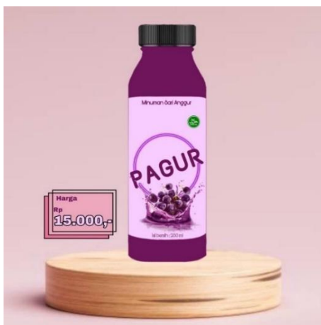
Gambar 4.36 Kemasan Sari Anggur Pagur