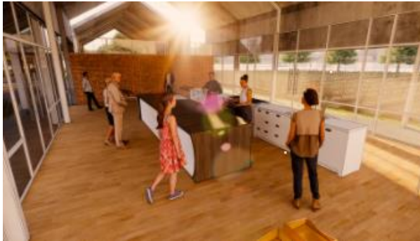
Gambar 8. Tampak Kiri Rumah Produksi Sari Anggur

anggur dan bisa menikmati secara langsung karena berdekatan dengan kafe.