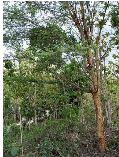
Gambar 1. Pohon Akasia Tomentosa [10]

Pemanfaatan jenis-jenis kayu tertentu, terutama pada kayu akasia yang memiliki karakteristik kayunya padat, berstuktur halus dan keras serta warna pohon yang menarik, dapat meningkatkan nilai estetika pada produk kayu yang dihasilkan, sehingga akan semakin banyak konsumen yang tertarik pada hasil-hasil kerajinan kayu masyarakat Desa Semoyo. Salah satu kayu yang dapat digunakan untuk menambah keunikan dekorasi produk adalah kayu akasia. Akasia yang memiliki jenis ranting muda berambut kuning, rapat, memiliki banyak duri, daun penopangnya berupa duri-duri kecil lurus yang panjangnya mencapai 4,5 cm (Gambar 1). Daun majemuk lebih menyirip, berseling, dengan tangkai daun 0,6-1 cm. Bunga berwarna putih atau putih kekuningan, kompleks. Sekitar 1-7 tonjolan berkumpul di ketiak daun di dekat ujung cabang. Buah polong, coklat tua. Kulit batangnya kasar, pecah-pecah menjadi bujur sangkar, dan berwarna putih keabu-abuan.[8]