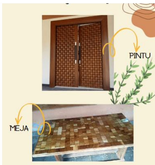
Gambar 2. Inovasi dari Kayu Akasia

Gambar 2 memperlihatkan contoh pengaplikasian kayu akasia yang dapat diolah oleh warga Desa Semoyo dengan menuangkan ide kreatifitas yang mereka dapat kembangkan dari contoh yang telah disampaikan melalui gambar 2 tersebut. Adanya kreativitas ataupun inovasi yang diberikan pada produk yang dibuat dapat meningkatkan nilai jual dan tingkat persaingan antar kompetitor. Maka dari itu, diperlukan peningkatan kreativitas dan pemasaran akan produk agar dapat meningkatkan pendapatan juga target pasar dari para pelaku usaha kerajinan kayu akasia dari masyarakat Desa Semoyo.