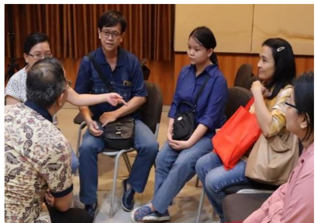
Gambar 3. Diskusi bersama Pakar, Orangtua dan Anak