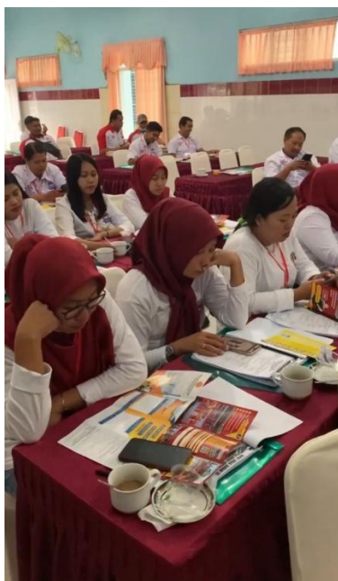
Gambar 4. Peserta Kegiatan Pengabdian Masyarakat DPD FKSPN Kabupaten Semarang

Kegiatan ini diikuti secara aktif oleh peserta yang terdiri atas pengurus DPD FKSPN, perwakilan serikat pekerja, serta mitra eksternal. Antusiasme peserta terlihat dari keaktifan mereka dalam sesi diskusi, tanya jawab, dan simulasi manajemen organisasi. Gambar 4 menunjukkan suasana peserta saat mengikuti kegiatan pengabdian secara langsung.