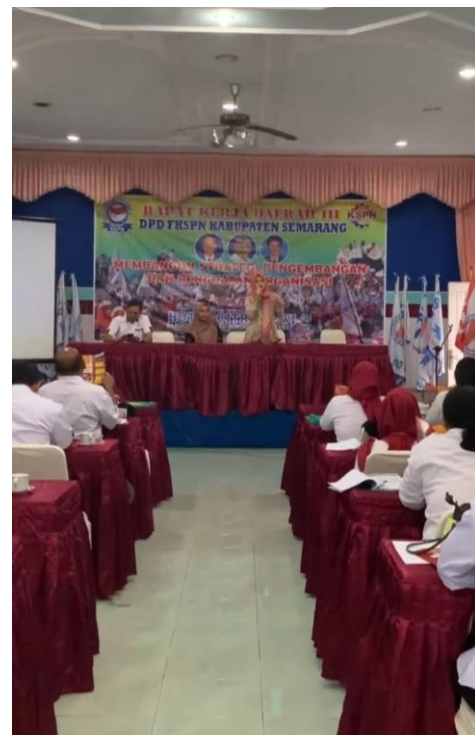
Gambar 2. Pendampingan Administrasi dan Pengelolaan Keuangan Organisasi

Selanjutnya, dalam pendampingan administrasi dan keuangan, pengurus diberikan pelatihan penggunaan aplikasi pengelolaan sederhana berbasis spreadsheet. Hal ini bertujuan untuk meningkatkan transparansi dan akuntabilitas laporan keuangan organisasi. Gambar 2 menunjukkan suasana pendampingan administrasi dan keuangan yang dilaksanakan secara tatap muka dengan melibatkan tim pengabdian dan pengurus organisasi.