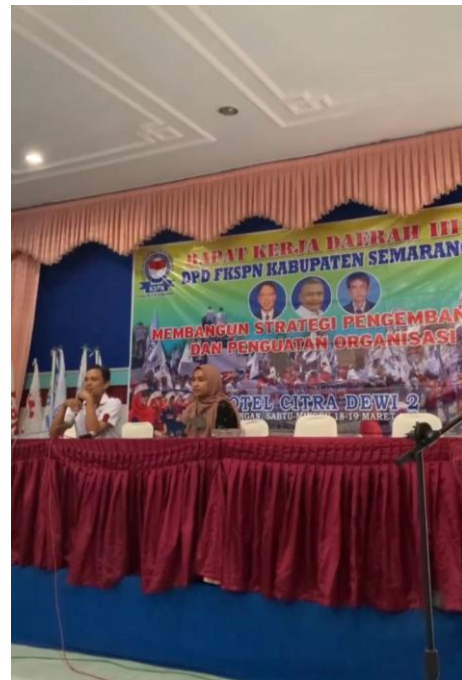
Gambar 1. Pelatihan Kepemimpinan Pengurus DPD FKSPN Kabupaten Semarang

Pada tahap pelatihan kepemimpinan, pengurus DPD FKSPN memperoleh pemahaman mengenai teknik komunikasi organisasi, penyusunan visi dan misi, serta penguatan kapasitas manajerial. Gambar 1 memperlihatkan proses pelatihan kepemimpinan yang diikuti oleh seluruh pengurus organisasi.