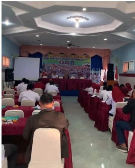
Gambar 3. Fasilitasi Jejaring Kerja Sama dengan Mitra Strategis

Selain itu, fasilitasi jejaring kerja sama dilakukan dengan menghadirkan mitra dari Dinas Tenaga Kerja Kabupaten Semarang, serikat pekerja lain serta beberapa LSM yang bergerak di bidang ketenagakerjaan. Upaya ini diharapkan memperluas jejaring strategis organisasi dan meningkatkan daya tawar DPD FKSPN dalam melakukan advokasi. Gambar 3 menunjukkan kegiatan diskusi dan peninjauan kerja sama dengan mitra eksternal yang diharapkan dapat mendukung keberlanjutan organisasi.