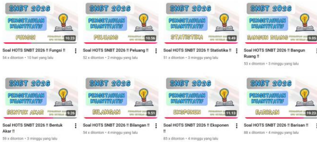
Gambar 4. Delapan Video yang Terunggah

Secara keseluruhan, hasil dan pembahasan ini menunjukkan bahwa pengembangan konten pembelajaran matematika berbasis video merupakan bentuk pengabdian kepada masyarakat yang relevan dengan kebutuhan siswa dan perkembangan teknologi pendidikan. Indikator keberhasilan kegiatan ditunjukkan melalui tersedianya konten pembelajaran yang sistematis, mudah diakses, dan berorientasi pada penguatan penalaran kuantitatif. Dengan demikian, kegiatan pengabdian ini tidak hanya berfokus pada pelaksanaan program, tetapi juga memberikan kontribusi edukatif yang berkelanjutan dalam mendukung kesiapan siswa menghadapi SNBT serta meningkatkan kualitas pembelajaran matematika secara umum.