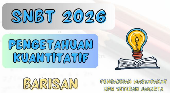
Gambar 2. Thumbnail Video

Dari sisi tampilan dan identitas visual, setiap video pembelajaran dilengkapi dengan thumbnail yang dirancang secara konsisten sebagaimana ditunjukkan pada Gambar 2. Thumbnail tersebut memuat informasi utama seperti tahun pelaksanaan SNBT, bidang materi, serta topik pembelajaran yang dibahas dalam video. Kejelasan dan konsistensi desain thumbnail ini berperan penting dalam membantu siswa mengenali konten secara cepat sebelum menonton video. Selain itu, tampilan visual yang informatif juga berkontribusi dalam meningkatkan kesiapan belajar siswa karena mereka telah memperoleh gambaran awal mengenai materi yang akan dipelajari.