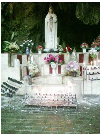
Gambar 5. Goa Maria Tritis

Goa Maria ini biasanya didatangi oleh umat Katolik untuk berdoa dan melakukan ziarah. Lokasinya yang jauh dari permukiman penduduk membuat suasana objek wisata religi ini tenang dan damai. Aksesnya juga cukup mudah dijangkau karena berada di tepi Jalan Lingkar Selatan Gunungkidul, di Dusun Bulu, Desa Giring, Kecamatan Paliyan, jalur menuju pantai selatan antara lain Pantai Krakal, Pantai Baron dan Pantai Indrayanti [5] .