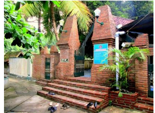
Gambar 6. Situs Ki Ageng Giring III

Situs makam ini merupakan makam yang diyakini sebagai penerima wahyu dari Kraton Mataram. Tak sedikit orang yang berziarah ke situs makam untuk berdoa memanjatkan puji kepada Tuhan Yang Maha Esa.