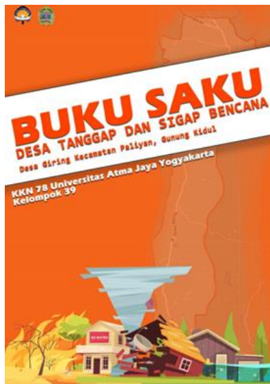
Gambar 7. Output Buku Saku Desa Tanggap dan Sigap Bencana Desa Giring