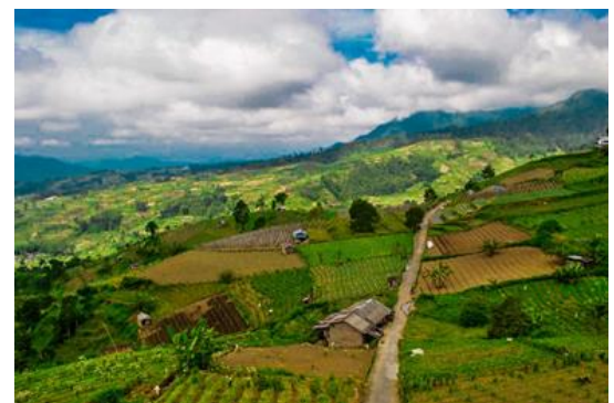
Gambar 1. Ilustrasi Desa Giring

Desa Giring terletak di Kecamatan Paliyan, Provinsi Daerah Istimewa Yogyakarta. Terdapat sembilan dusun yang berada di Desa Giring, yaitu Dusun Bulu, Dusun Singkil, Dusun Pengos, Dusun Gunungdowo, Dusun Pulebener, Dusun Candi, Dusun Giring, Dusun Kendal dan Dusun Nasri [2] . Desa dengan luas wilayah 1.014 hektar ini merupakan desa terluas ketiga di Kecamatan Paliyan. Adapun batas wilayah desa Giring untuk sebelah utara adalah Desa Mulusa, batas wilayah selatan adalah Desa Planjan dan batas sebelah barat adalah Desa Sodo.