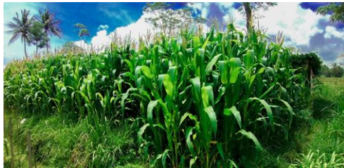
Gambar 4. Ilustrasi Bukit Teletubbies

Gunung Bagus yang awalnya berupa hutan jati kemudian berubah dan dimanfaatkan sebagai lahan untuk menanam jagung [2] . Lahan pertanian jagung itu kemudian dikenal sebagai Bukit Teletubbies dan menjadi objek wisata yang kerap kali dikunjungi masyarakat.