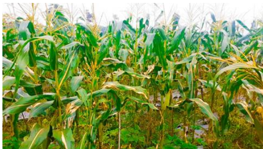
Gambar 2. Lahan jagung

Penduduk Desa Giring mayoritas bermata pencaharian sebagai petani. Hal ini menyebabkan sektor pertanian di Desa Giring menjadi potensi desa yang paling menonjol. Padi, jagung, kedelai dan juga kacang tanah adalah hasil tani yang dimiliki Desa Giring. Hasil pertanian utama Desa Giring sendiri adalah jagung, ini menjadi potensi desa yang dapat dimunculkan. Selain dari sektor pertanian, Desa Giring juga memiliki potensi dalam sektor peternakannya. Jenis hewan ternak utama di Desa Giring adalah sapi.