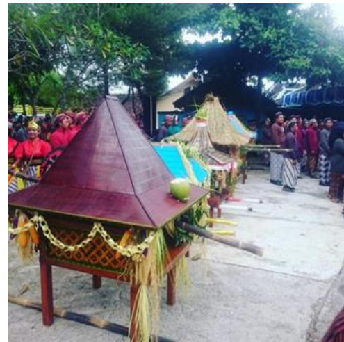
Gambar 3. Upacara Babad Dalam Giring

Desa Giring sendiri juga dikenal sebagai desa budaya dan masih sangat aktif melestarikan budaya mereka. Pelestarian budaya yang dilakukan terwujud melalui upacara adat yang masih rutin dilakukan, kesenian, kerajinan, permainan tradisional dan juga makanan tradisional. Upacara adat tahunan yang ada dan masih dilakukan secara rutin di Desa Giring adalah Babad Dalam Giring. Upacara Babad Dalam diselenggarakan setelah para petani panen padi pada hari Jumat Kliwon, dengan latar belakang filosofi bahwa pada hari tersebut memiliki kaitan dengan peristiwa ketika utusan dari Kraton mencari tempat makam Ki Ageng Giring. Upacara adat ini juga dapat ditemukan di desa lain, yaitu Desa Sada. Namun, seiring berjalannya waktu, upacara adat Babad Dalam diadakan secara terpisah antara Desa Giring dengan Desa Sada sehingga tercipta nama upacara adat Babad Dalam Giring yang artinya dilaksanakan oleh Desa Giring [3] .