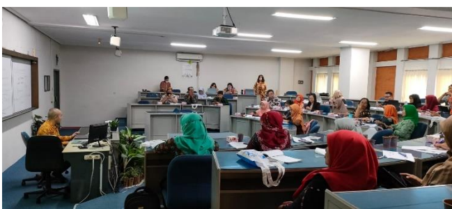
Gambar 7. Dokumentasi Kegiatan 2

Gambar 6 dan Gambar 7 di atas menampilkan kegiatan “Praktik Pembuatan Laporan Keuangan EMKM Menggunakan Excel”. Kegiatan ini dilakukan secara tatap muka dengan memberikan penyuluhan kepada guru-guru MGMP Ekonomi Provinsi Daerah Istimewa Yogyakarta.