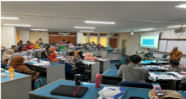
Gambar 6. Dokumentasi Kegiatan 1

Berikut merupakan beberapa dokumentasi kegiatan “Praktik Pembuatan Laporan Keuangan EMKM Menggunakan Excel”