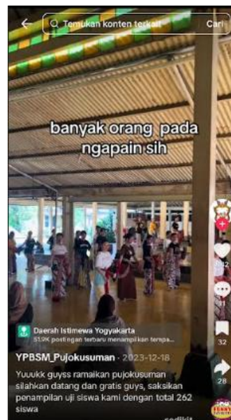
Gambar 4. Penggunaan Bahasa Kekinian pada Konten Tiktok Sanggar Tari YPBSM Yogyakarta

Mas Alin menjelaskan upaya sanggar menarik minat generasi muda dengan cara menyusun narasi-narasi kreatif dalam kontennya, seperti menyisipkan ajakan dalam bentuk tagline yang dekat dengan bahasa sehari-hari generasi muda.