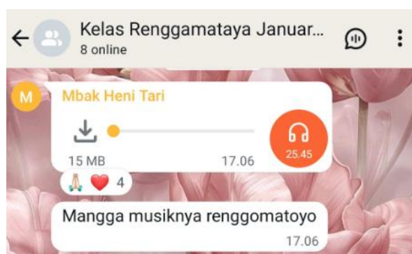
Gambar 2. Chat Guru Tari Saat Mengirimkan Gendhing

Pemanfaatan media digital dalam konteks pendidikan dilakukan untuk mendukung proses belajar-mengajar. Salah satu bentuk pemanfaatannya adalah dengan mendistribusikan gendhing atau musik pengiring tari melalui grup WhatsApp kelas. Gendhing ini dikirim oleh pengajar kepada siswa yang membutuhkan iringan untuk latihan di rumah. Dengan adanya akses terhadap gendhing tersebut, siswa dapat berlatih secara mandiri di luar sesi tatap muka, tanpa harus menunggu latihan bersama di sanggar. Berikut merupakan grup WhatsApp kelas Renggamataya: