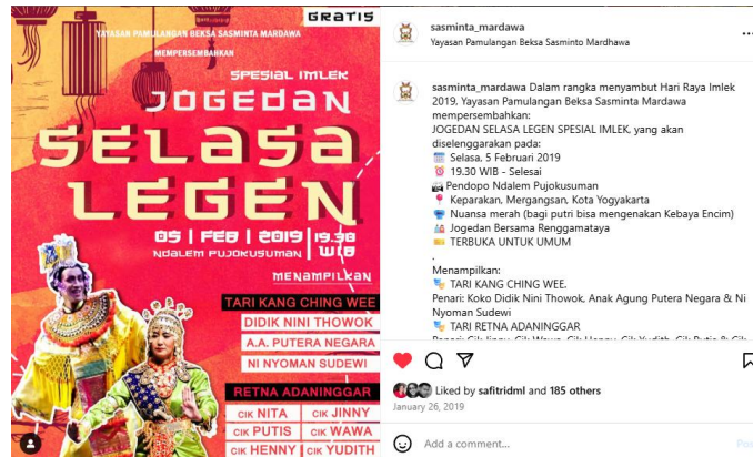
Gambar 3. Publikasi Kegiatan Selasa Legen

Konten yang disajikan tidak hanya berupa penampilan tari, tetapi juga testimoni siswa, cuplikan latihan, serta informasi kegiatan sanggar. Berikut adalah publikasi yang ada di Instagram Sanggar Tari YPBSM Yogyakarta: