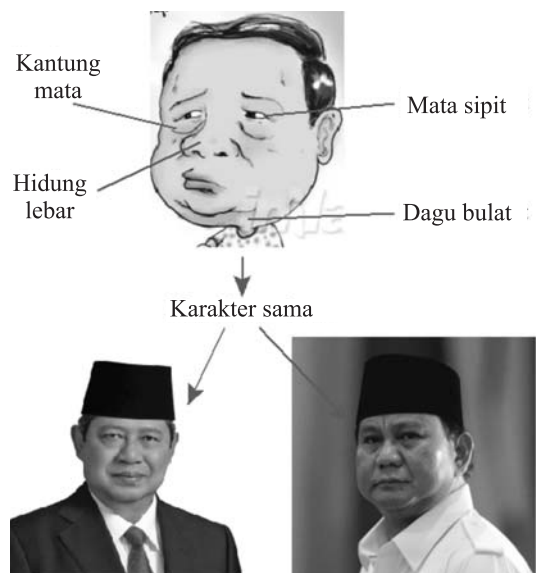
Gambar 2 Gambar Kartun Memiliki Persepsi Berbeda terhadap Tokoh yang Digambarkan

Penggambaran karikatur dengan teknik manual adalah modalitas rendah. Kartunis membutuhkan keahlian khusus untuk meriset tokoh agar mampu menonjolkan ciri khas figur dalam kartunnya, sehingga pembaca bisa mengenali dan membedakannya dengan figur lain. Oleh karena itu, kartunis Inilah.com menampilkan karakteristik tertentu pada tokoh yang digambarkan untuk memberi petunjuk bagi pembaca agar mengenali siapa tokoh yang digambarkan, meskipun ciri-ciri yang digambarkan bisa memiliki persepsi berbeda dari pembacanya.