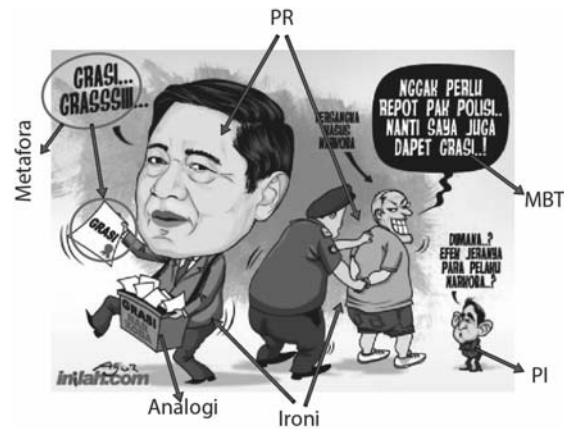
Gambar 4 Grasi Pidana Narkoba, Tak Ada Efek Jera?

Kartun ini menggambarkan SBY sedang membawa kotak bertuliskan “ Grasi Narkoba ” dan di dalamnya terdapat kertas. Di tangan kanannya, ada kertas bertuliskan “ Grasi ”. Kartunis juga menuliskan “ Grasi... Grasssiii... ”, yaitu kata yang diucapkan kartun SBY. Kegiatan SBY memiliki konotasi pekerjaan pedagang asongan di pinggir jalan raya. Di belakangnya terdapat gambar dua orang pria. Orang pertama mengenakan seragam polisi dan orang kedua berambut pirang sedang tersenyum