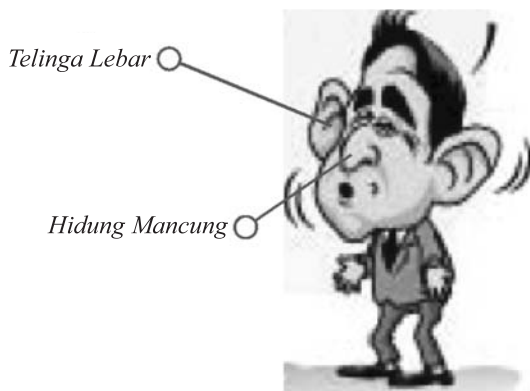
Gambar 1 Tokoh Lapod Digambarkan dengan Telinga Lebar dan Hidung Mancung

Kartunis, dalam menghadirkan realitas politik terkait SBY menggunakan dua teknik penggambaran, yaitu digital tracing dan analog-digital . Kartun yang dibuat dengan teknik analog , cenderung menghasilkan karikatur yang tidak mirip dengan tokoh yang dimaksud. Berbeda dengan teknik digital tracing yang menghasilkan gambar karikatur yang bisa menyerupai tokoh yang diwakili. Pemilihan teknik digital tracing dalam penggambaran karikatur SBY merupakan modalitas visual