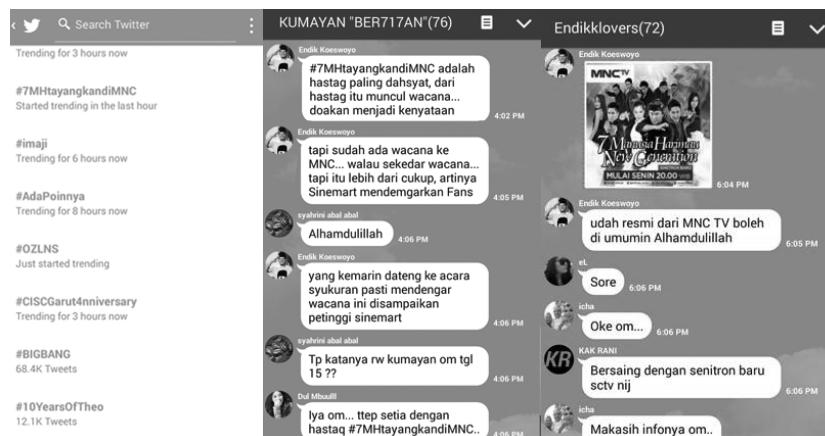
Gambar 3 Keberhasilan Tagar #7MhtayangkandiMNCTV

Sementara itu, kampanye tagar di Twitter merupakan salah satu aksi kolektif yang sering dilakukan para penonton 7MH . Tercatat sudah cukup banyak tagar yang diluncurkan seperti: #kembalikanjatayang7MH, #matikanTELEVISItanpa7MH, #save7MH, dan lain-lain. Kampanye tagar dapat teretus dari inisiatif penonton atau dikoordinatori oleh penulis naskah 7MH , Endik Koeswoyo, yang aktif bergabung dalam berbagai forum dan grup penonton. Keberhasilan kampanye tagar yang fenomenal adalah tagar #7MhtayangkandiMNCTV yang dilancarkan secara intensif beberapa minggu sebelum 7MH tamat. Para penonton berupaya meminta kepada RCTI untuk memindah penayangan 7MH ke MNCTV yang berada dalam satu grup korporasi media dengan RCTI. Keberhasilan kampanye tagar tersebut terukur dengan dipenuhinya harapan penonton. Pada 11 April 2016, penayangan musim kedua 7MH yang diberi judul New Generation benar-benar ditayangkan di MNCTV.