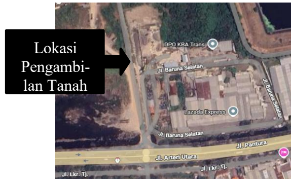
Gambar 1. Lokasi Pengambilan Sampel Tanah

Kota Semarang, yang dapat dilihat pada Gambar 1 dengan tahapan penelitian yang dilakukan sebagai berikut :