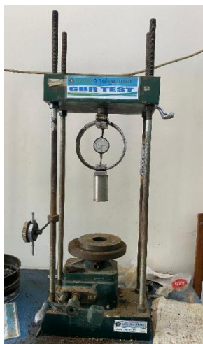
Gambar 6. Penetrometer

Hal ini menunjukkan efektivitas yang lebih tinggi dibandingkan dengan penelitian Aji et al. (2025). Perbedaan ini kemungkinan terjadi karena disebabkan oleh karakteristik awal tanah lempung eksisting di kawasan pesisir Tanjung Mas Semarang yang memiliki kadar air lebih tinggi dan plastisitas lebih besar, sehingga ruang perbaikan lebih luas.