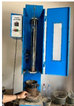
Gambar 5. Proctor Modified

Proctor Modified merupakan mesin yang terdapat logam silinder yang digunakan untuk memadatkan tanah dalam uji proctor dimana dengan jumlah tumbukan 25 kali tumbukan agar tanah tersebut padat dengan maksimal, hasil tumbukan untuk menentukan kepadatan maksimum dan kadar air optimum. Peralatan tersebut dapat dilihat pada Gambar 5 dibawah ini: