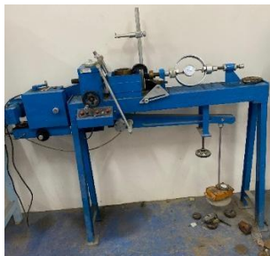
Gambar 4. Alat Uji Direct Shear

Pengujian ini dilakukan untuk mendapatkan parameter kohesi dan sudut geser pada sampel tanah dengan menggunakan alat uji direct shear seperti pada Gambar 4. Alat uji direct shear merupakan alat yang terdiri dari beberapa komponen arloji dan komponen pembebanan yang berfungsi untuk menentukan kekuatan geser tanah, dimana sampel tanah diletakkan dalam kotak geser yang dibagi dua arah vertikal dan horizontal untuk mensimulasikan tekanan normal dan gaya geser.