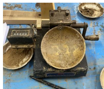
Gambar 3. Alat Cassagrande

Secara kimiawi, ion kalsium (Ca 2+ ) dari hasil hidrasi semen dalam mortar busa berinteraksi dengan permukaan lempung yang bermuatan negatif, menggantikan ion-ion monovalen (Na + , K + ) dan mengurangi ketebalan lapisan ganda, sehingga air yang teradsorpsi berkurang dan plastisitas menurun (Mitchell & Soga, 2005).