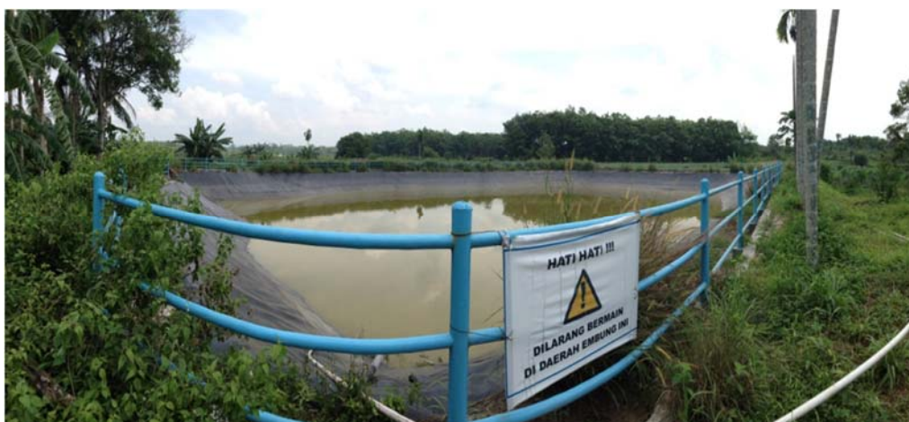
Gambar 4. Embung Lingkar Naga

Beberapa petani menggarap lahan dengan cara "menumpang", yaitu petani menggarap lahan yang bukan milik mereka disertai perjanjian dengan pemilik lahan. Lahan yang dikerjakan oleh petani banyak dimiliki oleh pengusaha-pengusaha dari Kota Jambi maupun dari kota-kota yang lain.