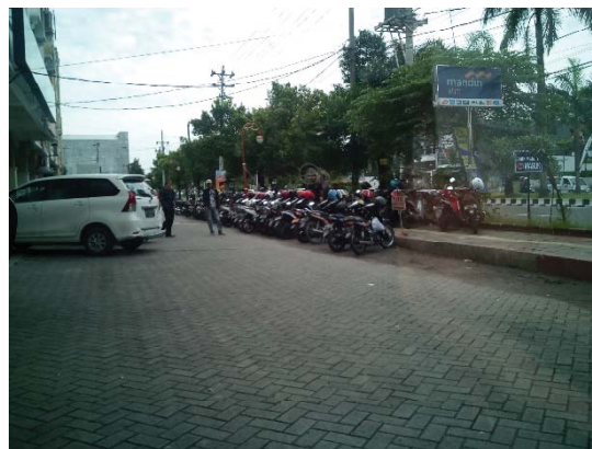
Gambar 2b. Situasi halaman depan kompleks ruko bisnis Solo Baru

Jalur pejalan kaki tersebut baru dibuat dan diselesaikan pada tahun 2014. Awalnya halaman ruko yang memiliki lebar sekitar tujuh meter tersebut mampu menampung sampai 30 kendaraan roda empat dan juga 30 kendaraan roda dua. Namun, dengan adanya jalur pejalan kaki yang melintasi halaman ruko tersebut, maka lebar halaman ruko tinggal sekitar