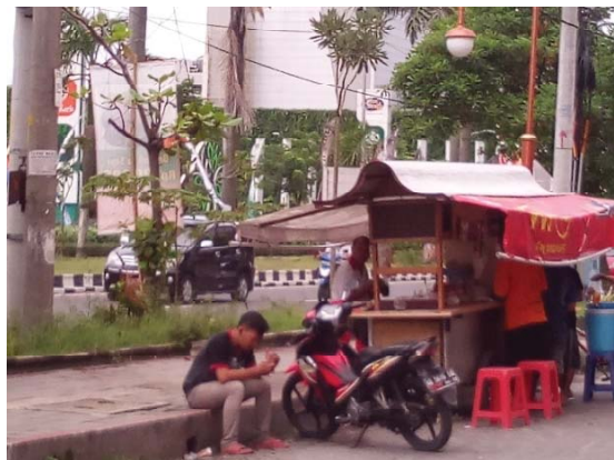
Gambar 2a. Situasi halaman depan kompleks ruko bisnis Solo Baru

Berikut adalah foto-foto yang menggambarkan bagaimana kondisi jalur pejalan kaki yang melintas di halaman deretan ruko bisnis Solo Baru.